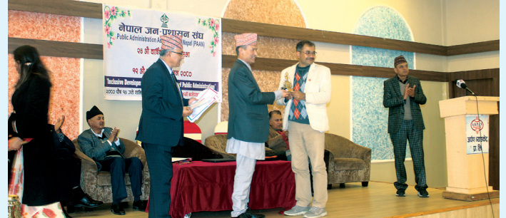
(पानको १९औं राष्ट्रिय सम्मेलनको अवसरमा प्रस्तुतिकर्तालाई अध्यक्षद्वारा पानको चिनो प्रदान)