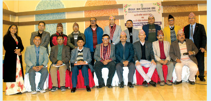
(नेपाल जन-प्रशासन संघको २४ औं साधारण सभापश्चात् संघका पदाधिकारीहरू समेत)